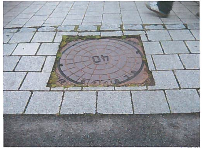
20. Sunket dæksel. (Ved plantebæltet)