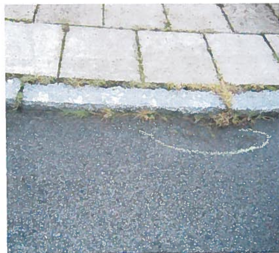
5. Græs, som vokser gennem asfalten