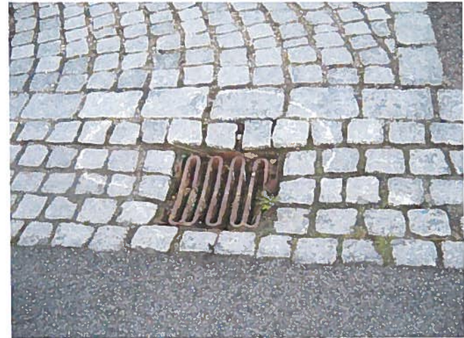
11. Sunket rist og løse brosten. (Ud for nr. 15)