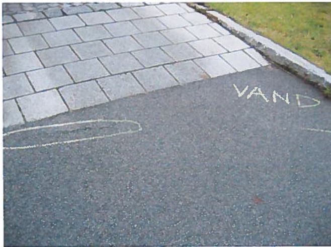
3. Revne i asfalt, samt område med bagfald, hvor der kan stå vand.