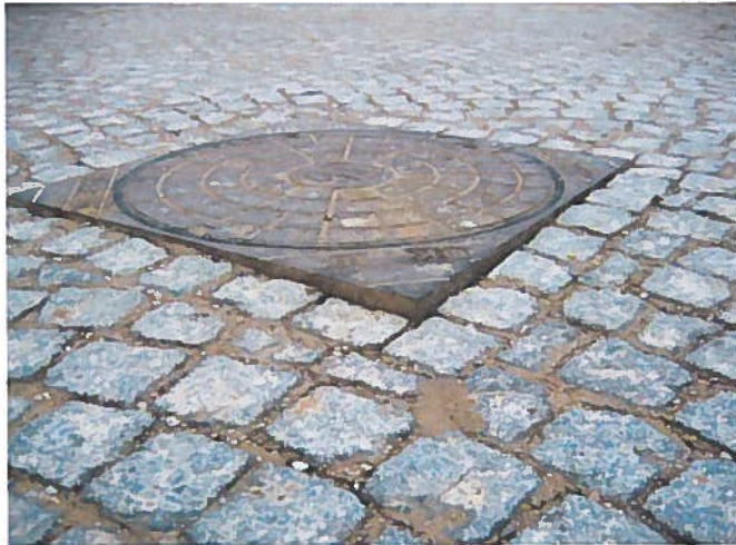
21. Dæksel for højt i forhold til belægning. (Ved nr. 43)