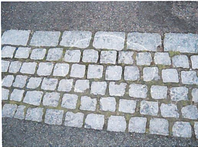
10. Løse brosten. (Ud for nr. 17)