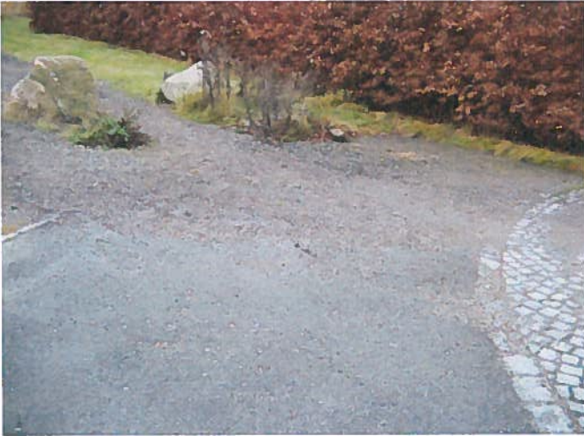
8. Grus fra stien skylles ned over vendepladsen. (Østlige ende)