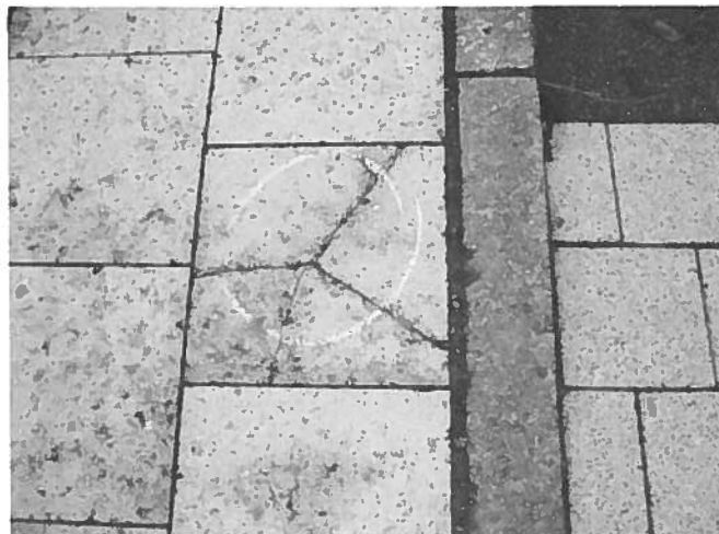
15. Revnet flise. (Ud for nr. 8)