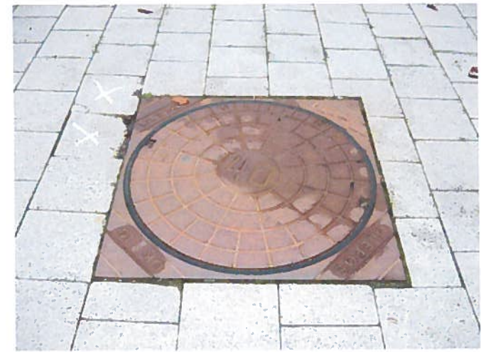
13. Dæksel kan vippe. (Ud for nr. 15)