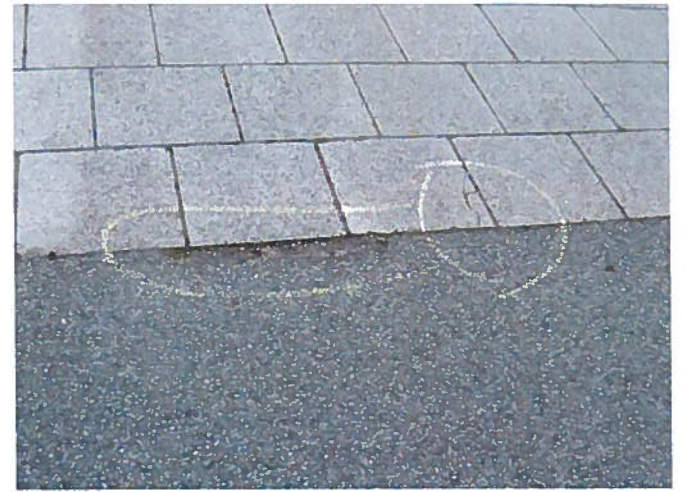
4. Nedbrydning af asfalt, samt knækket flise.