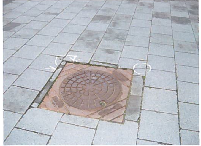
9. Dæksel som ikke er i niveau med flisebelægningen. (Østlige ende)