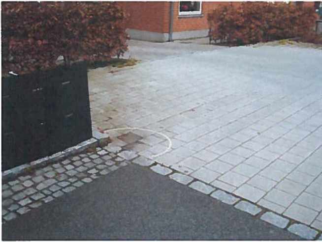
19. Lunke i flisebelægning, hvor vand kan samles. (Ud for nr. 20A)