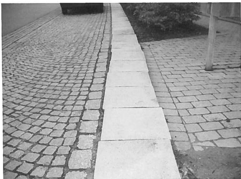
17. Udskudte fliser ud for nr. 12-14