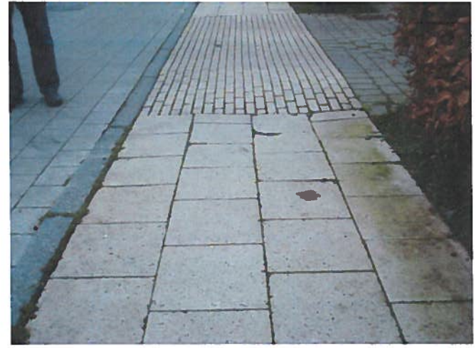
22. Lunke i flisebelægning, hvor vand kan samles. (Ud for nr. 27B)