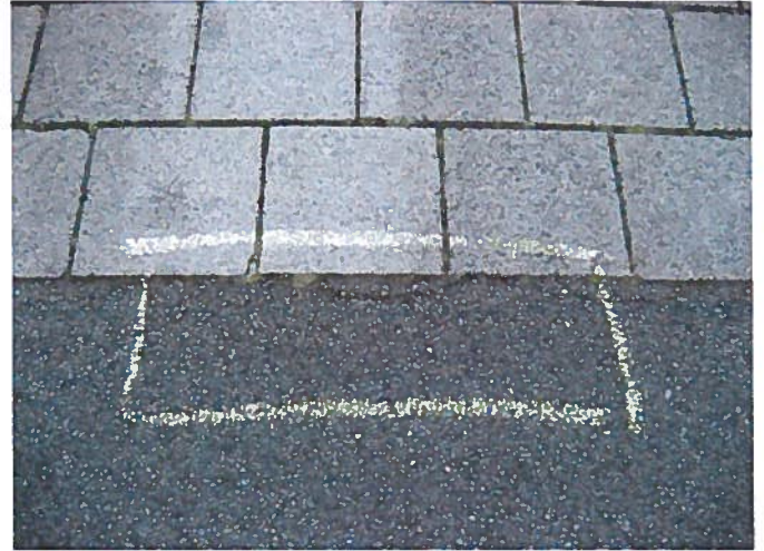
2. Revner i asfalt