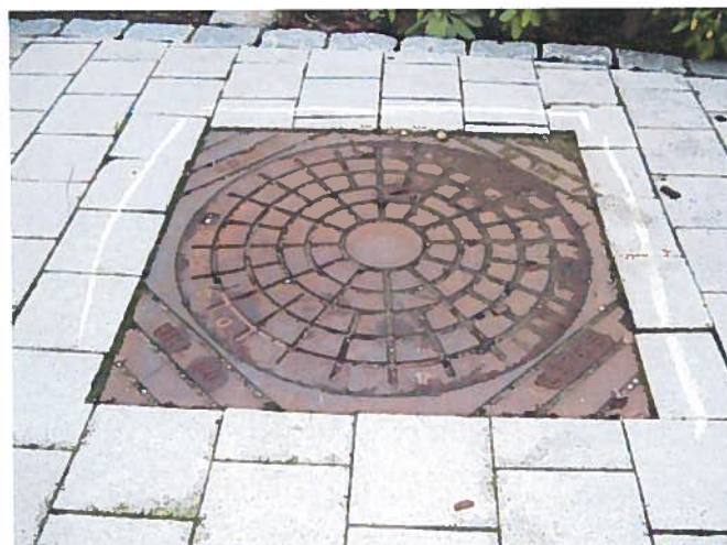
12. Sunket dæksel og løse fliser. (Ud for nr. 15)