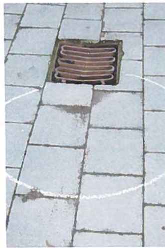
6. Lunke hvor der står vand, som ikke kan løbe i risten. (For enden af østlig gren)