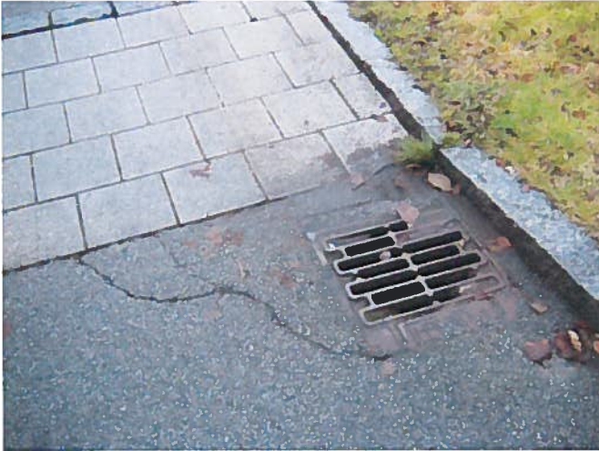
1. Revner i asfalt