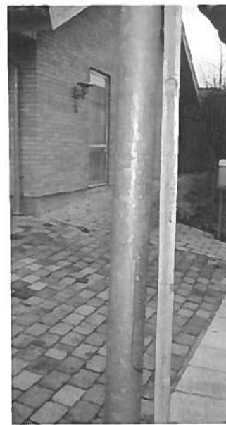
18. Skæv lygtepæl. Mere end 3° ude af lod. (mellem nr. 13 og 15)