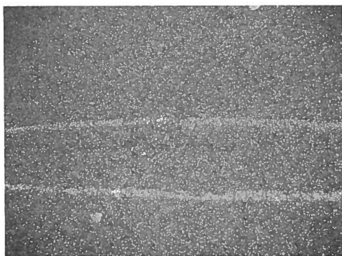
16. Revne i asfalt, to steder ud for nr. 4.

Østerhøjvej fra Bustræde til Måløv Parkvej er en kommunal vej og er derfor ikke inspiceret i detaljer på hele strækningen.