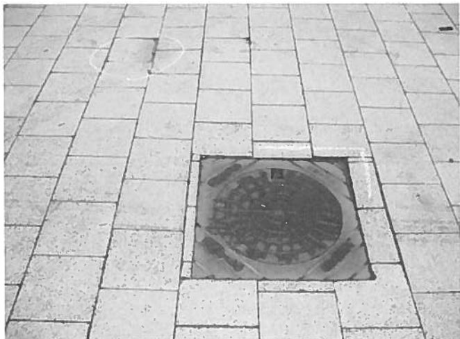
14. Dæksel ude af niveau og sunkne fliser. (Ud for nr. 9)